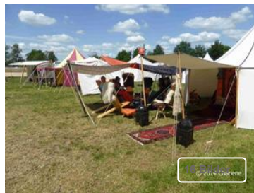
Ein mittelalterliches Zelt Dorf

Hoch zu Ross in ihren glänzenden Rüstungen bieten sie einen archaischen Anblick, den man sonst aus Geschichtsbüchern kennt. Aber diese Ritter der Neuzeit treffen sich zu Wettkämpfen , die im Vergleich zum Mittelalter harmlos erscheinen. Es geht zwar Mann gegen Mann (oder auch gegen Frau, denn Ritterinnen gibt es auch!!!), aber nicht Auge um Auge oder um Leben und Tod. Gekämpft wird um die Wette. Die Ziele sind Ritterhelme, Äpfel, Nachbildungen von Wildschweinen, Ringe oder ähnliche Ziele. Wer am meisten Punkte sammelt, hat gewonnen. Die Ritterschaft, die am meisten Punkte erringt, ist die Siegermannschaft.