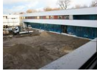
Mehr Betten in der Bergstraße