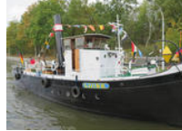
Luise kehrt heim

Bereits das achte Jahr in Folge Mittelalter zum Miterleben