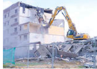
Wieder eine Platte weniger