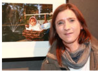
Die Jugend war trotzdem schön und bunt