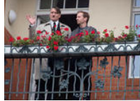
Wirbel um Auftritt von Hitler-Double